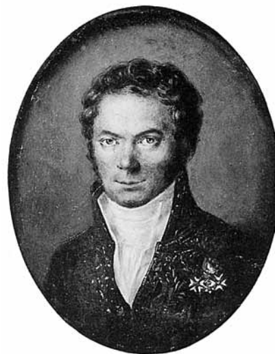
Луи-Антуан Фовеле де Бурьенн

Он все же решил проверить слова Жюно и найти подтверждение им у других. Бонапарт обратился к Бертье, и тот также рассказал все, что знал.