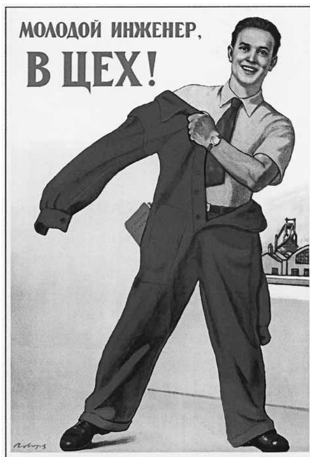
В. И. Говорков. Плакат, 1956

4. Связь советской высшей школы с народным хозяйством. Еще одна характерная черта советского вуза — его неразрывная связь с хозяйством. Он не давал образование свободным индивидам, которые потом сами решают, где им применить свои знания, и значит, сами несут ответственность за то, найдут они себе работу или нет. Это свойственно как раз западному вузу. Советский вуз давал образование гражданам, которые, став специалистами, были обязаны отдать свой труд и умения в той области хозяйства, на какую им укажет государство. В СССР суще-