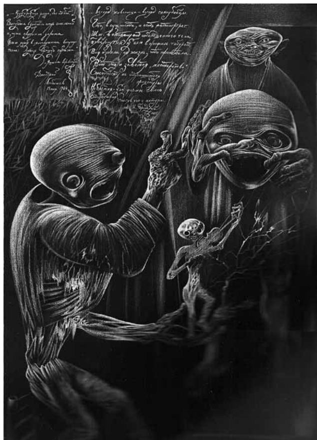
Иллюстрации Шемякина. Тексты Бобышева и Бродского

Я не совсем понимаю, как Вы оцениваете труд художника, но могу Вас уверить только в одном, что выполнить восемнадцать сложнейших иллюстраций в столь рекордный срок, дабы сдержать свое слово, это — задача довольно непосильная для многих и многих художников. Я занимаюсь издательской дея-