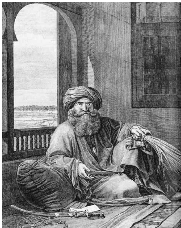
Мурад-бей. Из книги «Описания Египта». Гравюра Николая Понса по рисунку Андре Дютертра

Новый правитель Египта должен был платить жалованье солдатам. Месячная сумма выплат оценивалась в миллион франков. Пытаясь изыскать эти средства всеми возможными методами, Бонапарт послал срочную записку Клеберу. Он приказал за-