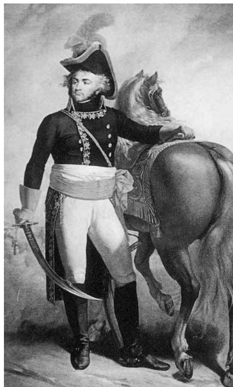
Жан Батист Клебер. С картины Антуана Жана Жозефа Ансио

Наполеон не хочет терять одного из способнейших военачальников и пускает в ход весь свой авторитет, все свое обаяние с тем, чтобы удержать Клебера в рядах восточной армии. «Я крайне недоволен вашим нездоровьем, я надеюсь, что воздух Нила будет хорош для вас и, оставив позади пески Александрии, вы, возможно, найдете, что Египет не так плох, как вы представляли это в начале... Поверьте, я хочу видеть, что вы быстро восстановились, я высоко ценю ваше уважение и дружбу. Я знаю, что