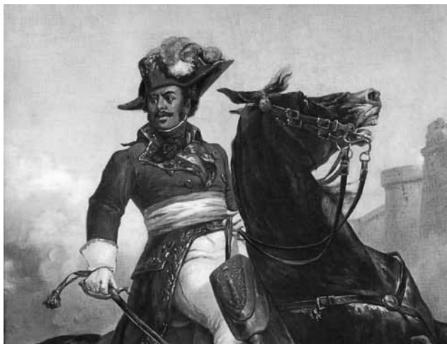
Генерал Александр Дюма

— Черт побери, французы вы или нет? — воскликнул Монж.